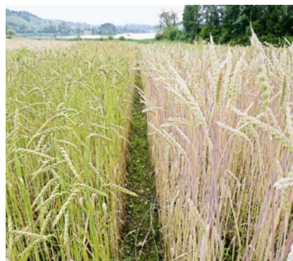
Ein Wechseldinkel für mehr Vielfalt: die farbige Dinkelsorte FLAUDER kann auch im Frühling gesät werden.