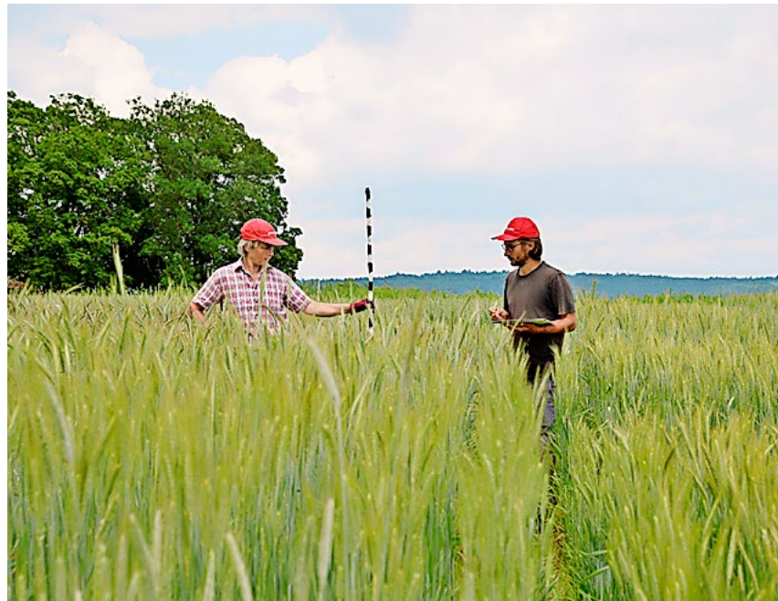
Triticalesorten im Vergleich: Die gzkp bei der Felderhebung.