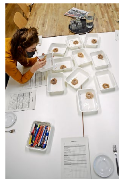
Emmerpasta: Welche schafft es am Schluss auf den Teller des Konsumenten?