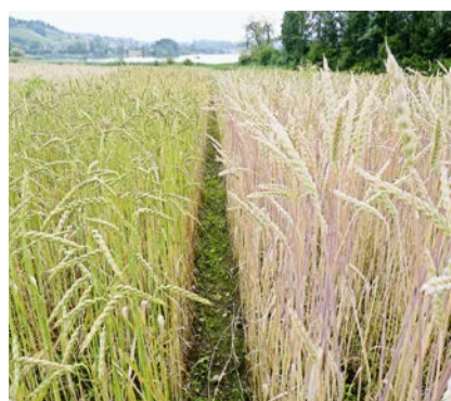
Ein Wechseldinkel für mehr Vielfalt: die farbige Dinkelsorte FLAUDER kann auch im Frühling gesät werden.